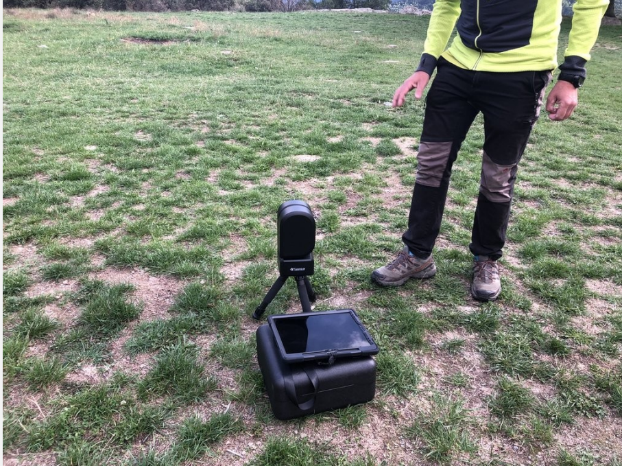
Detall telescopi i tauleta per facilitar la visibilitat