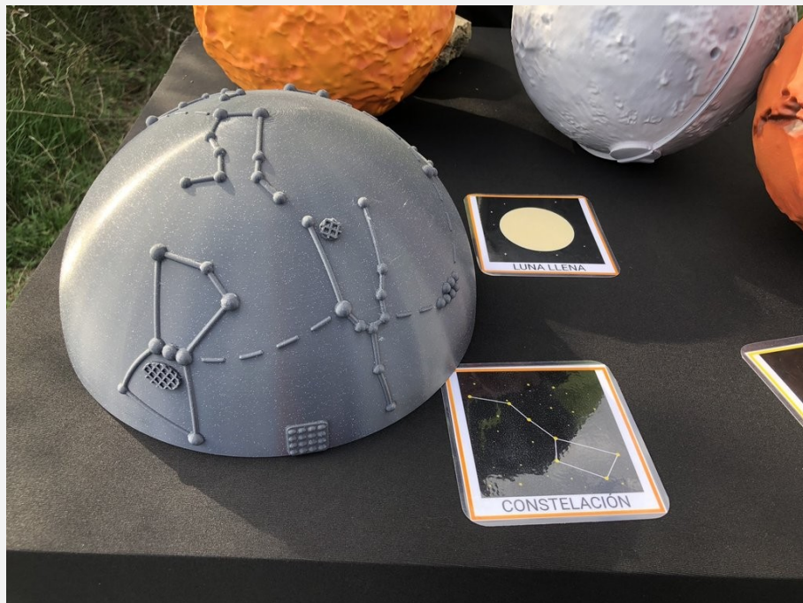
Detall dels materials utilitzats