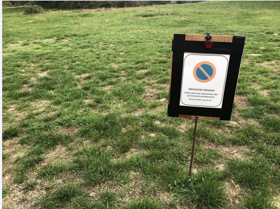
Senyalització zona activitat