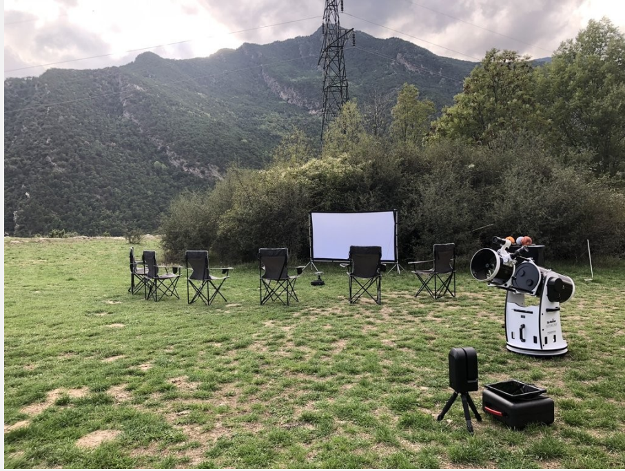
Zona de l'activitat