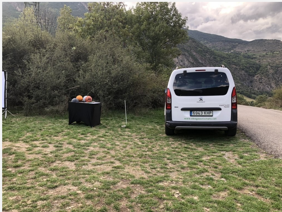
Aparcament i detall distribució de material de suport