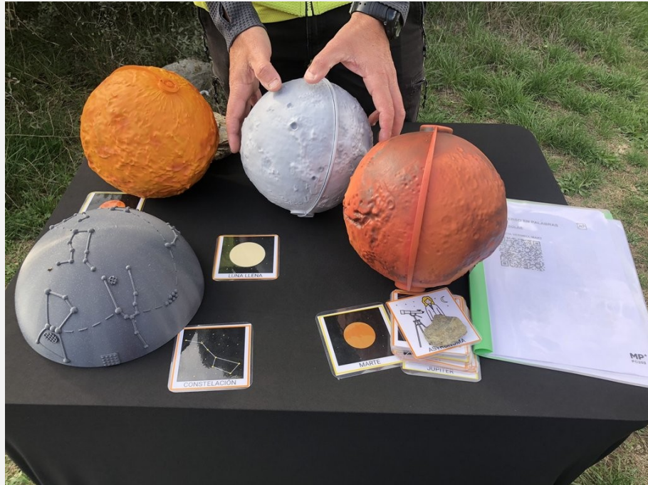
Detall dels materials sensorials i de lectura fàcil